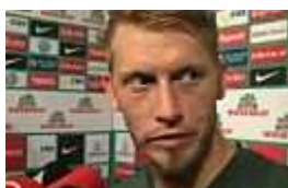
Hunt glaubt an Werder-Sieg