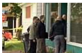
Tote Kinder: War der Python der

Turnigy Aerodrive SK3 - 3542-1000kv Brushless 22,12 €