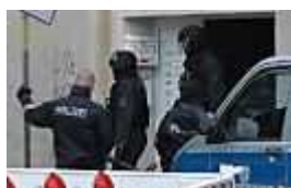
Polizeieinsatz in der Neustadt